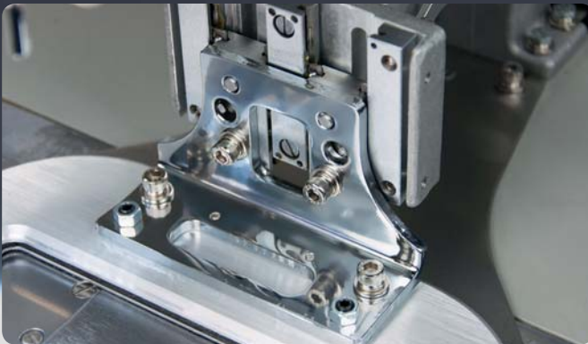
Adjustment screws TC 1310 G // Einstellschrauben TC 1310 G