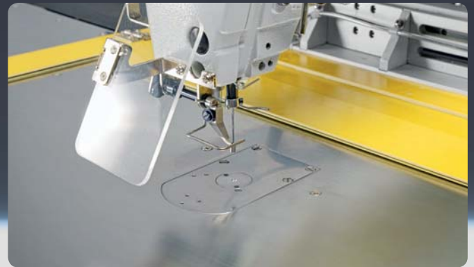
Sewing area TC 6040 G // Nähbereich TC 6040 G