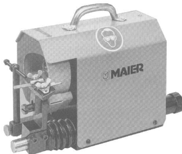
Maier-Unitas malli 90 terien terotuskone