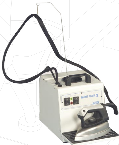
1013 Minivap 2